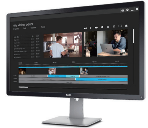
采用 PremierColor 技术的 Dell UltraSharp 超高清 4K 显示器 | UP3216Q